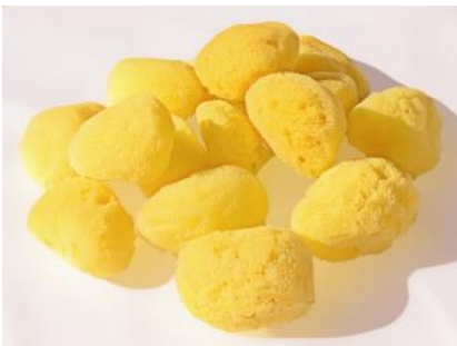
Chiffon doux non abrasif ou éponge